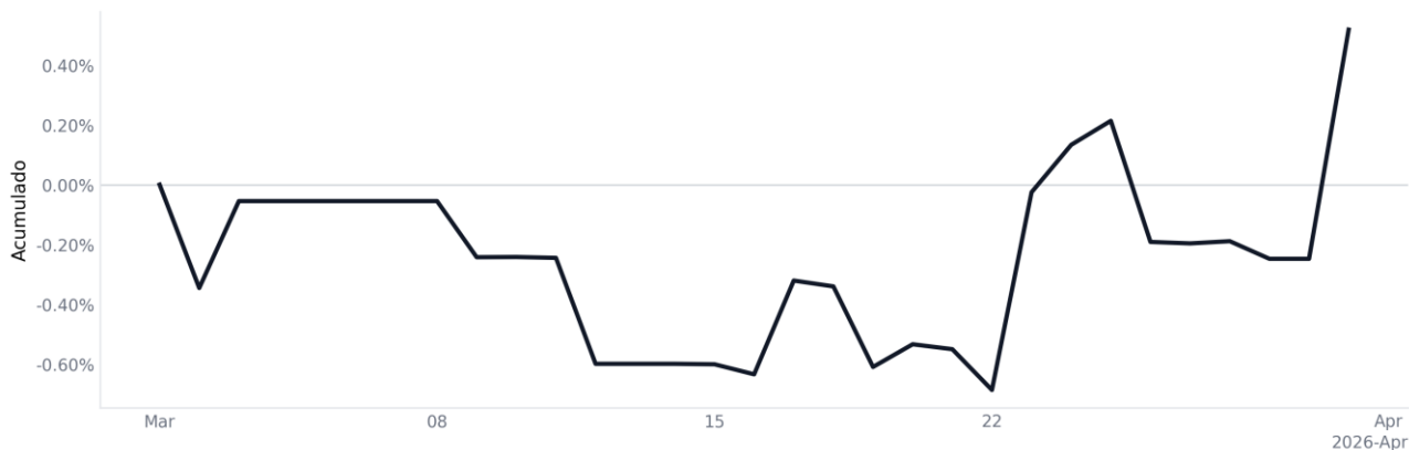
Figura 2 — Evolução do Rendimento.