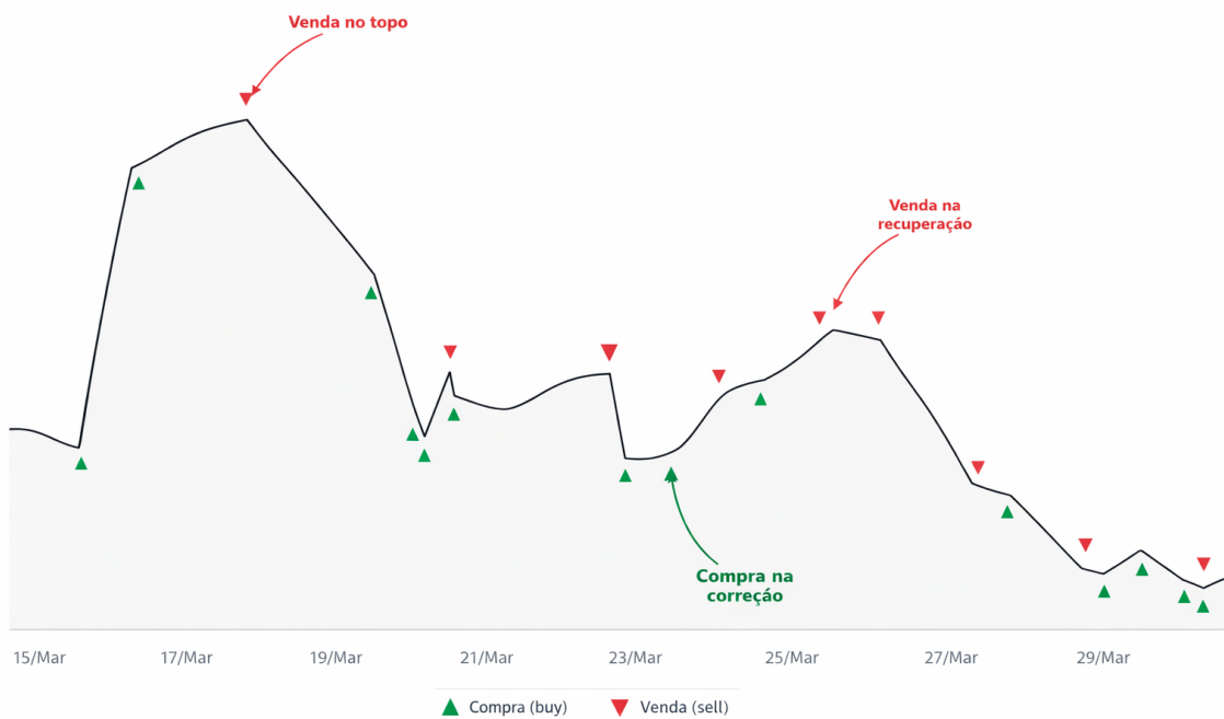
Figura 1 — Nova estratégia.